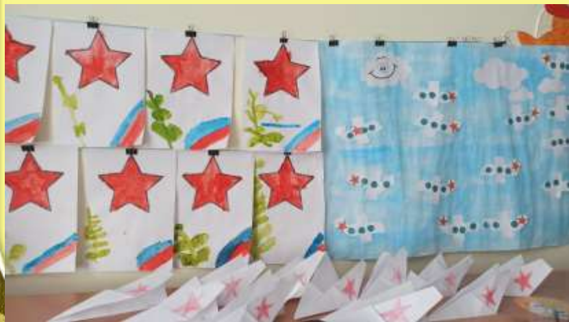
← Открытка для папы, коллективная работа «Летят самолеты», конструирование «Самолет»