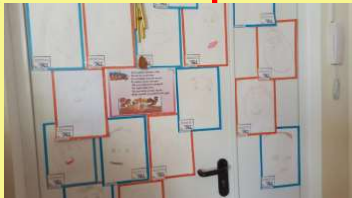
← Выставка рисунков «Мой папа – мой герой»