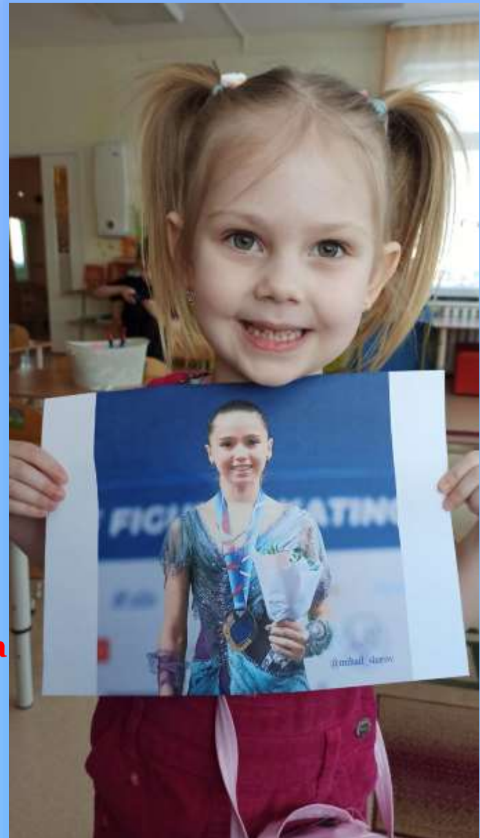
Камилла Валиева (фигуристка)