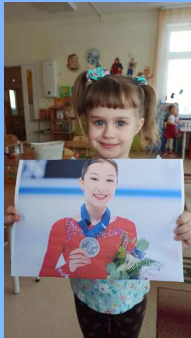
Элизабет Турсынбаева (фигуристка)