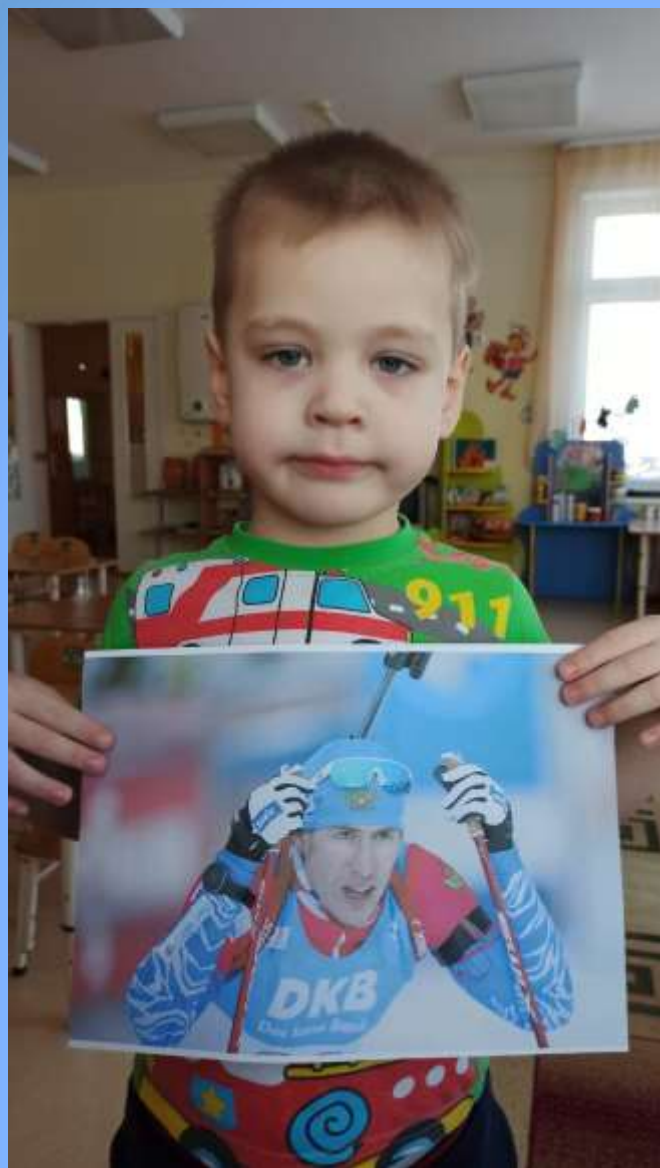
Эдуард Латыпов (биатлонист)