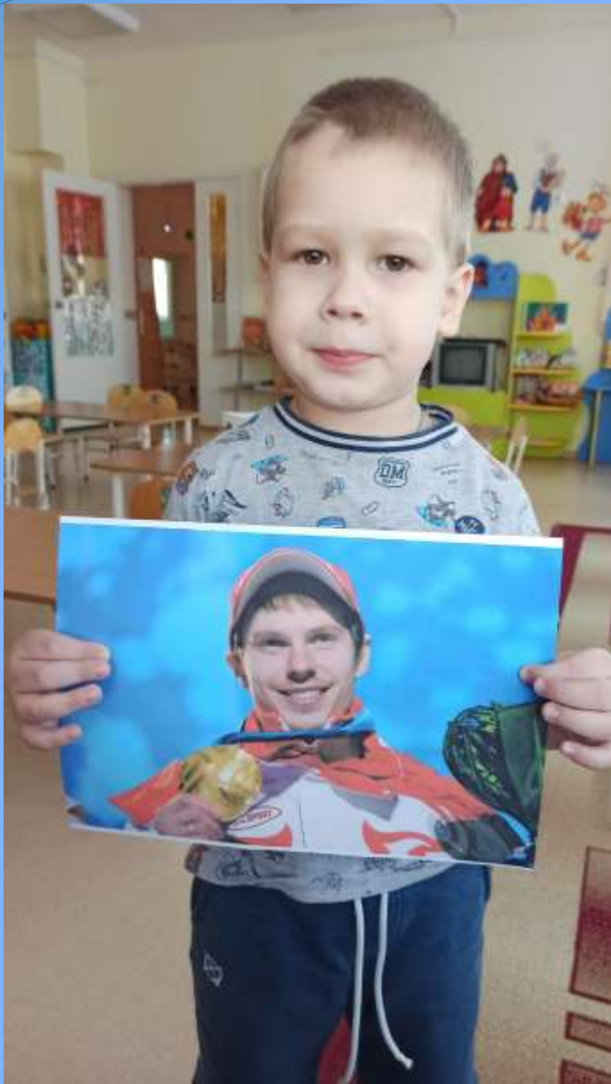
Сергей Устюгов (лыжник)